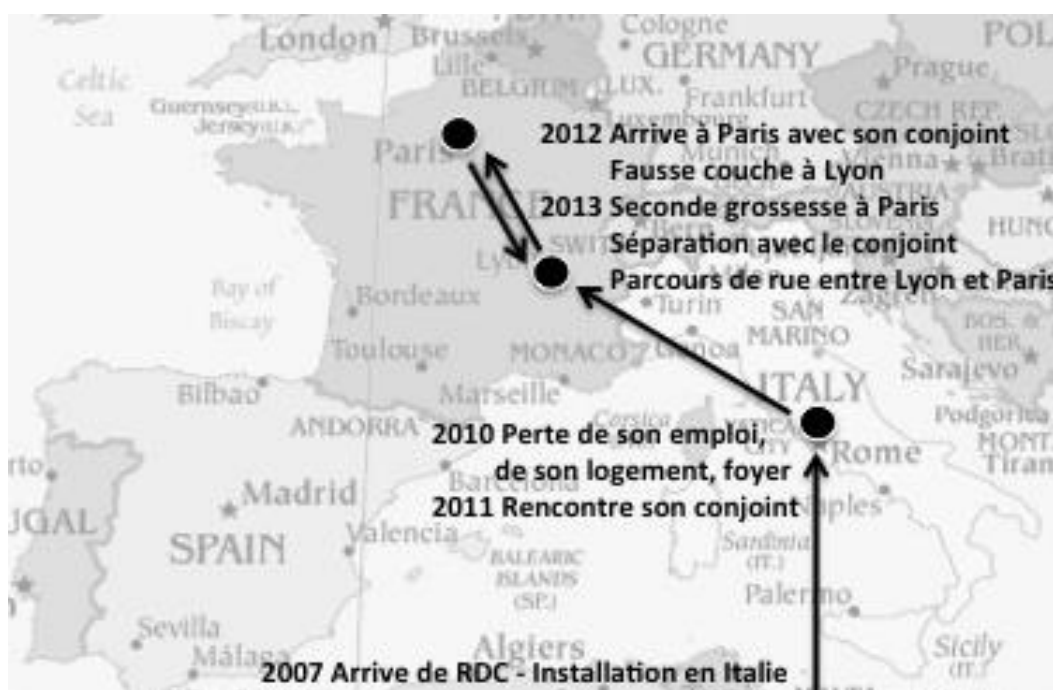
Figure 2 : Une trajectoire européenne en pointillés